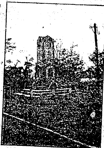
Споменик Кочи кайиџану код Текије; хладњачу су овде извадили из Дунава

Уз много спешивања и интересовања ко смо ми и зашто се о томе интересујемо, овај човек испричао нам је следеће: